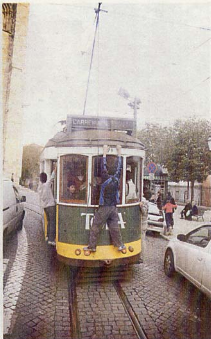
El espíritu de un país. Portugal es el protagonista de 'Voyage 2007', una invitación a viajar sin salir de Burgos. La luz, el mar, los tranvías, la gente de la calle. Pequeños trozos de realidad secuestrados por la cámara de Igor Gonzalo para mostrar la vida en su vertiente más auténtica.