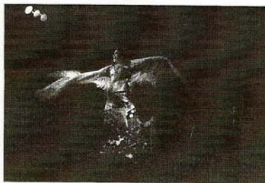
Espectáculo en un tablao flamenco sevillano.

«no ha parado de tirar instantáneas», confirma satisfecho con lo logrado a pesar de su juventud. Se confiesa gustoso de los retratos y de la fotografía de viajes, de lugares y personas. No obstante asegura que, además, hace todo lo que se le pida.