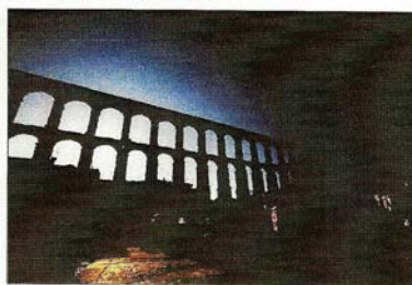
Vista nocturna del acueducto de Segovia.