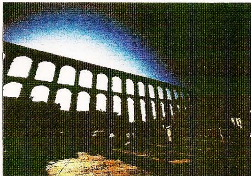
El acueducto de Segovia, una de las joyas patrimoniales de la ciudad castellana.

partamento de Turismo ha decidido apoyar la exposición - y en Burgos, por supuesto».